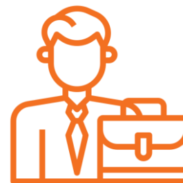
Количество юрлиц и ИП в регионе